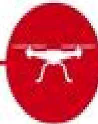
Uncrewed Aerial Systems (drones)