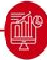
Data Analysis & Visualization Systems