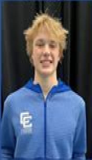
Detroit Catholic Central Lake Mychalowych 1:37.98